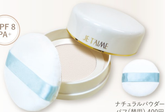
ナチュラルパウダー パフ(替用) 400円