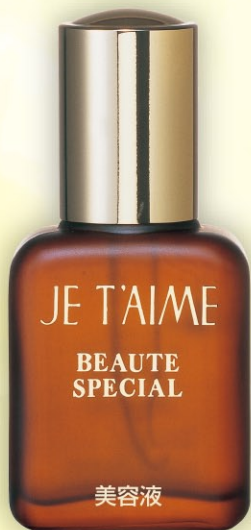
美容液 ポータスペシャル 30ml 10,000円(税込)