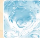
とらふぐコラーゲン