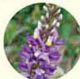
フェラリア ミリアフィカ

イソフラボンを豊富に含むブエラリアは、女性ホルモンと似た働きで、お肌の細胞を活性化しターンオーバーを促進してメラニンの排出を高めます。