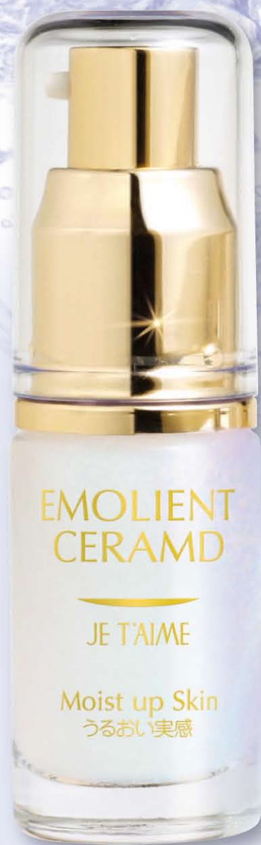
エモリエントセラムD 15ml 6,600円(税込)