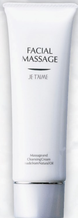
フェイシャルマッサージ 110g 4,600円(税込)