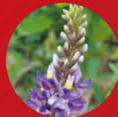
プエラリアミリフィカ

タイハーブのプエラリアミリフィカに 含まれるイソフラボンは、年齢と共 に減少する女性ホルモンの代わりに 繊維芽細胞に働きかけ、コラーゲン やヒアルロン酸の生成を再び活性化 します。イソフラボンを補うことで、 ハリ・ツヤをアップさせ、弾力性のある みずみずしい肌をつくります。